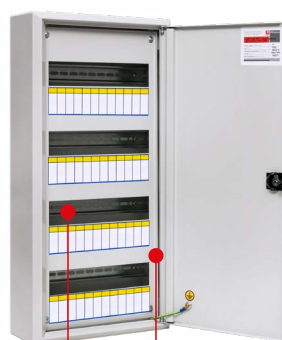
Оцинкованные DIN-рейки Защитная фальш-панель

Предназначены для размещения различного модульного оборудования. Конструкция щитов предусматривает защиту от контакта с токопроводящими элементами, электрощиты оснащены съемной фальш-панелью. Электрощиты изготовлены из российской стали, соответствующей ГОСТ 1050-88, имеют сварной конструктив, что обеспечивает их высокую жесткость и герметичность соединения частей.