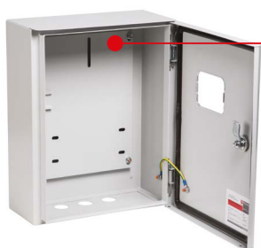
Оцинкованная монтажная панель

Щиты учетные ЩУ EKF PROXIMA предназначены для ввода электроэнергии и ее учета. Электрощиты имеют возможность опломбировки и защищены от коррозии и разрушающего воздействия погодных факторов благодаря фосфатированию и использованию атмосферостойкой порошковой краски, что позволяет наружное размещение.